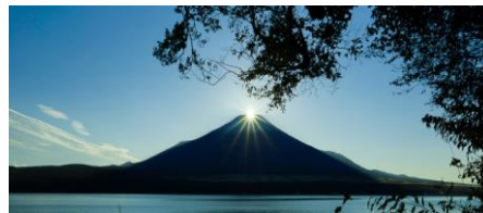
ダイヤモンド富士